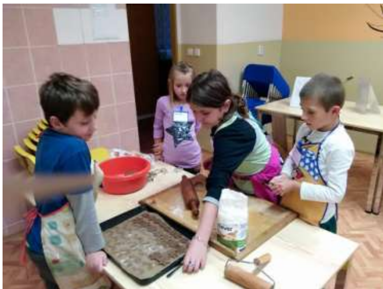
Příprava Vánoce - pečení cukroví na kroužku Vaření